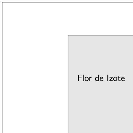
Finca en el 2024.

Tres octavos de una finca cuadrada se dedican al cultivo de flor de Izote en 2024. Para 2025, se espera que la demanda de este cultivo aumente, por lo que se incrementó el ancho del terreno dedicado a dicho cultivo en 2 m . Después de este cambio, el terreno destinado al cultivo de la flor de izote tiene forma cuadrada y el área del terreno no utilizado para el cultivo disminuyó en 12 m^2 . Determinar el perímetro de la finca.